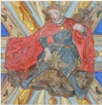
Décor de clef de voûte (XVI e ).