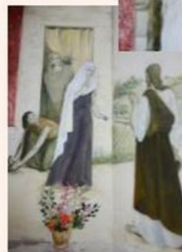
Après sa résurrection, Jésus rend visite à Marie.