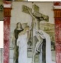
La scène du Calvaire.