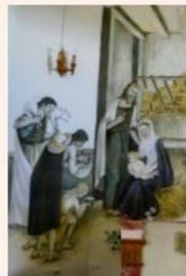
Une évocation de l'adoration des bergers.