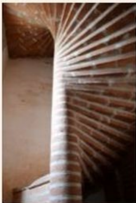
Un escalier hélicoïdal (ou à vis) dessert la tribune et le clocher.

Cette architecture, demeurée en bon état, est assez rare dans notre région et mérite l'attention.