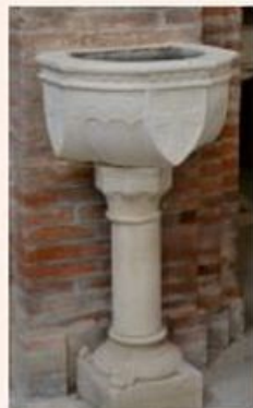
Fonts baptismaux et bénitier , sculptés dans la pierre blanche.