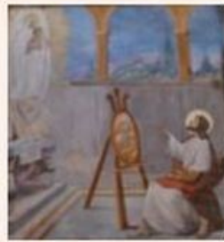
St Luc peint le portrait de la Vierge