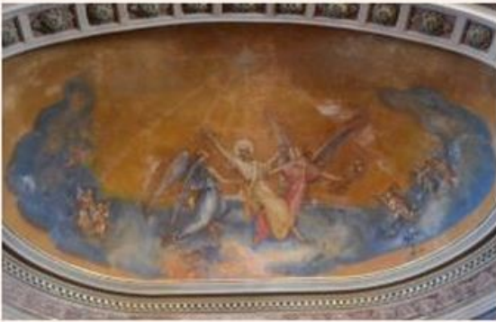
St Éleuthère (ou Lautier) élevé aux Cieux