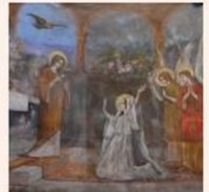
St Jean donne la communion à la Vierge