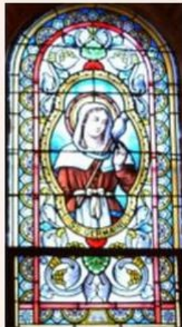
Sainte Thérèse de Lisieux