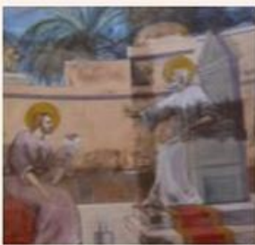
St Marc écrit l'Évangile sous la dictée de St Pierre