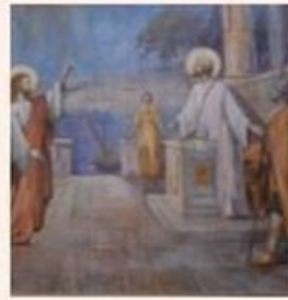
St Matthieu appelé à l'apostolat